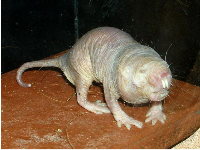
Рисунок 1. Голый землекоп

4. Выберите из списка ниже общую особенность всех позвоночных?